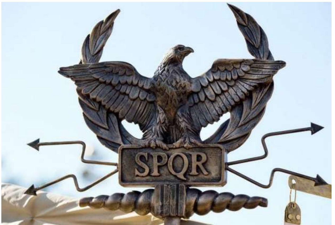
Рисунок 4. Орёл