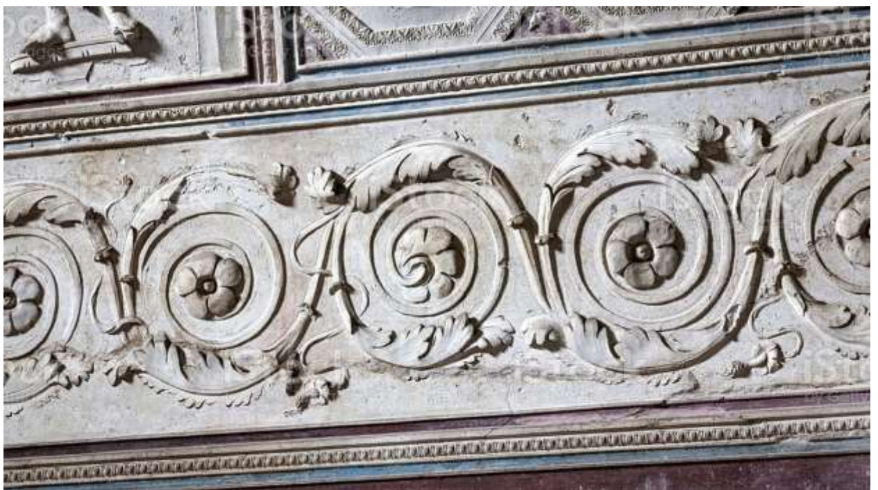
Рисунок 2. Лист аканта и виноградные листья