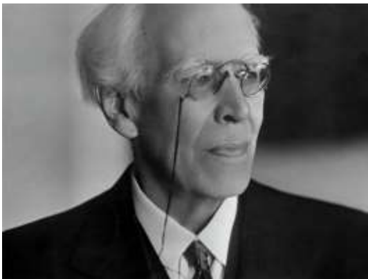
Прил. 11. Станиславский Константин Сергеевич