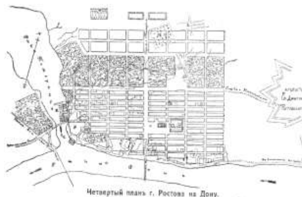
Прил. 4. План Ростова 1811 года