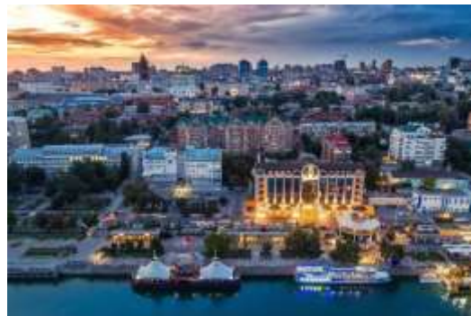
Прил. 2. Вид на современный Ростов