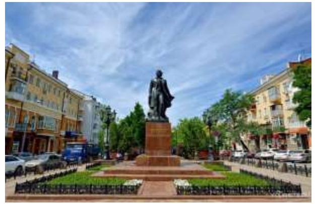
Прил. 8. Пушкинская улица