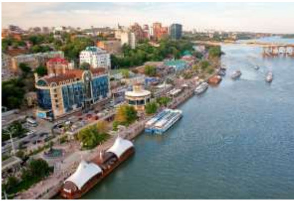
Прил. 7. Набережная