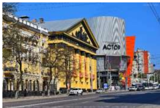
Прил. 6. Будёновский проспект