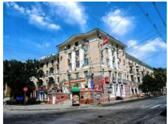
Прил. 12. Московская улица