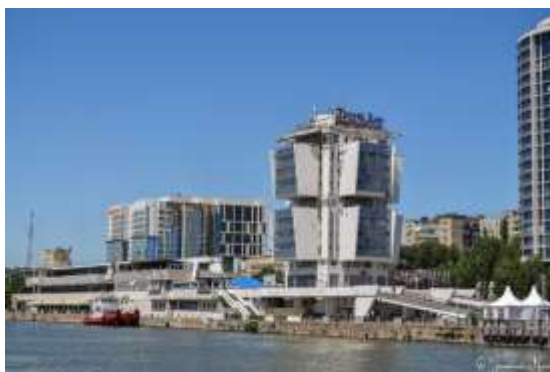
Прил. 5. Улица Береговая