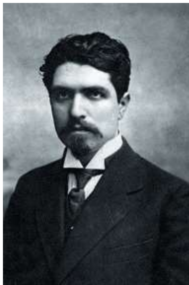
Прил. 14. Шаумян Степан Георгиевич