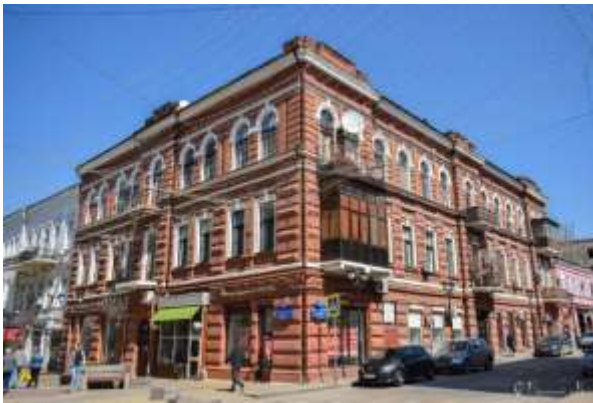
Прил. 9. Улица Шаумяна