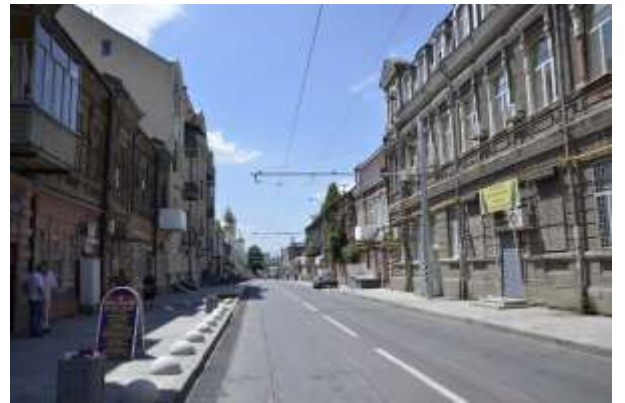
Прил. 10. Улица Станиславского