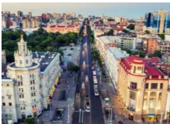
Прил. 3. Улица Большая Садовая